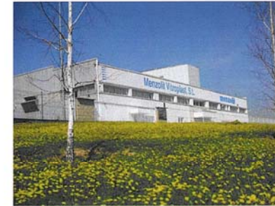
Vista de la Fachada principal de Menzolit Vitroplast S.L.

Ya a principios de la década de los 90, Menzolit Vitroplast, S.L., entonces como DSM Compounds Vitroplast S.L., se comprometió con el objetivo de compatibilizar nuestra actividad industrial con el desarrollo sostenible, el respeto y la protección del Medio Ambiente. La implantación y el desarrollo de nuestro Sistema de Gestión Medioambiental nos han permitido, de una manera progresiva, minimizar y controlar los efectos de nuestra actividad de una manera responsable y eficaz.